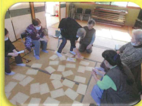
ふれあいのつどい(写真は高尻の様子。絵合わせゲームをしています)