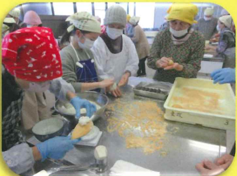
共助の基盤づくり事業(多世代交流クッキング)

こども園・小学校・中学校・福祉委員協議会・自主防災・小さな親切運動・食生活改善推進協議会・青少年健全育成連絡協議会・庵治支援隊・花プロジェクト