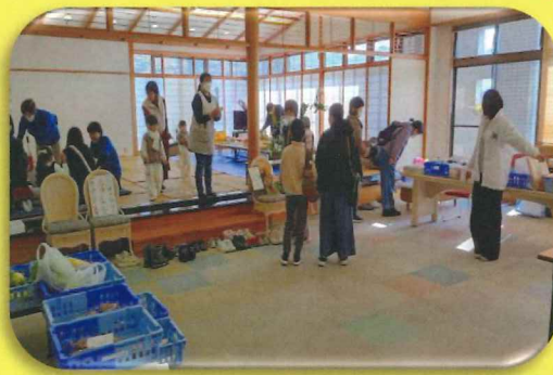
第6回健康・福祉まつり