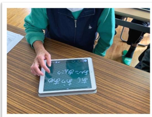
◀【脳若トレーニング】 NPO法人シニアと地域を元気にする会の方を招いて、iPadを使い、ゲームをしながら、楽しく認知トレーニングをしています！