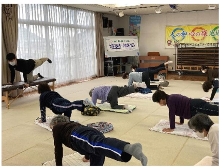
▲【ありす体操教室】 ありす鍼灸整骨院の先生をお招きし、目指せ100歳を合言葉に、姿勢の改善と各部位の動きを良くする体操を実施しています！

今年度も新型コロナの影響を受けた1年間であり、開催を断念することもありましたが、地域で孤立しがちな高齢者や子育て中の母親などに対し、少しでも交流の場や仲間づくりの機会を提供していきたいと思い、感染対策を行いながら開催しました。今回はこれまで実施した活動を紹介したいと思います！