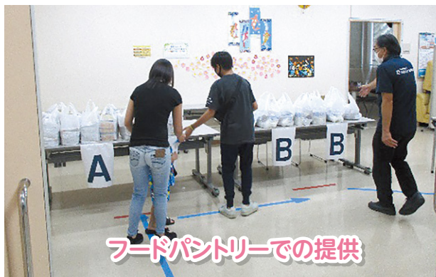
フードパントリーでの提供