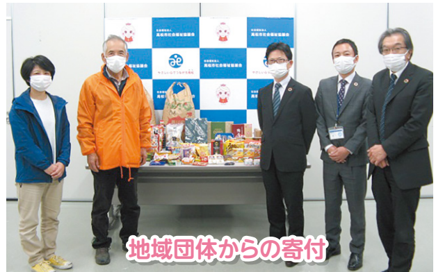
地域団体からの寄付