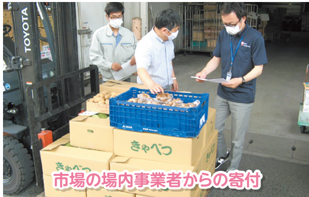
市場の場内事業者からの寄付

本会では、寄付で集められた食品を、必要に応じて生活困窮世帯や福祉団体、子ども食堂等に提供しています。また、最近ではコロナ禍によって経済的苦境に陥っているひとり親世帯や学生のみなさんにも支援を拡大しています。